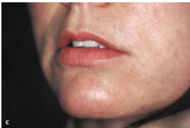
Abb. 5 c Zustand 3 Monate nach der CO 2 -Laserbehandlung.