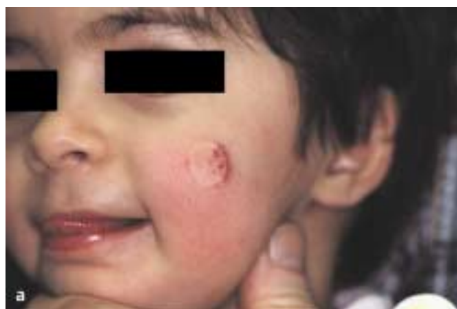
Abb. 2 a Verbliebene Hämangiomreste nach Kontaktkryotherapie.

Der gepulste Farbstofflaser ist mit der Kontaktkryotherapie die Therapiemethode der Wahl [4,11,20,27,31] (Abb. 2 a u. b). Mit dem gepulsten Farbstofflaser wird in über 90% der Fälle in 1–4 Sitzungen im Abstand von 2–4 Wochen ein Wachstumsstopp erzielt, Hohenleutner et al. berichten sogar über eine Erfolgsquote von 97% [27]. Eine vollständige Aufhellung wird dabei in ca. 40%, eine über 75%ige Clearancerate in etwa 70% der Hämangiome erzielt. Die besten Ergebnisse werden bei einer Dicke von \leq 3 mm erreicht. Das Risiko für bleibende Nebenwirkungen ist niedrig ( < 1\% ).