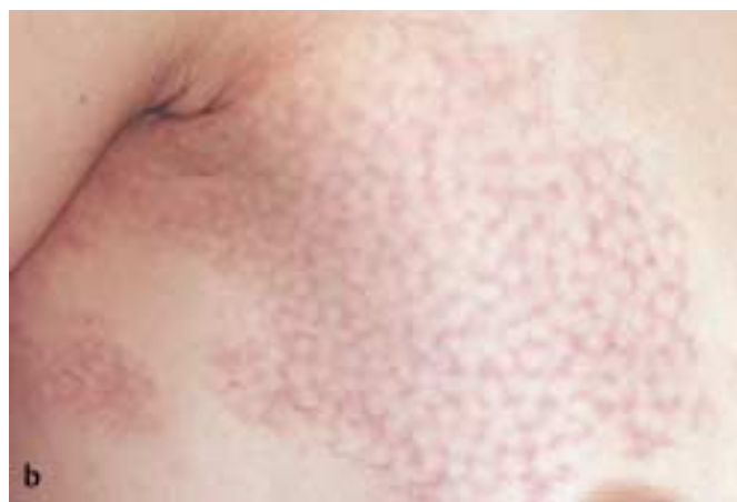
Abb. 3 b Z. n. einer Sitzung durch gepulsten Farbstofflaser.