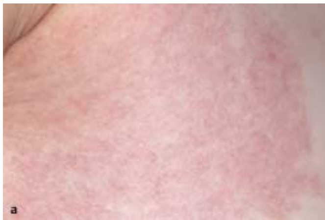
Abb. 3 a Nävus flammeus.

Teleangiektasien werden ihrer Entstehungsursache nach in primäre und sekundäre eingeteilt. Zu den primären Teleangiektasien zählen der Naevus teleangiectaticus, das Bloom-Syndrom