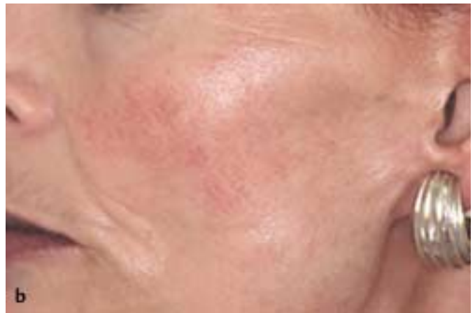
Abb. 4 b Z. n. 3 Behandlungen durch langgepulsten KTP-Nd:YAG-Laser.

ebenso wie die Flächenausdehnung, die Lokalisation, die Gefäßgröße und -tiefe, welche zuvor mittels farbkodierter Duplexsonographie bestimmt werden sollten, limitieren allerdings o.g. Vorgehensweisen. Am besten bewährt hat sich für diese Indikation die IPL-Technologie [25,39,43]. Der Einsatz des gepulsten Farbstoff- und langgepulsten KTP-Nd:YAG-Lasers sowie die Kryotherapie sind aufgrund der geringen Eindringtiefe ineffektiv.