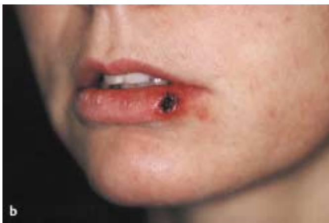
Abb. 5 b Zustand direkt nach dem Lasereingriff.