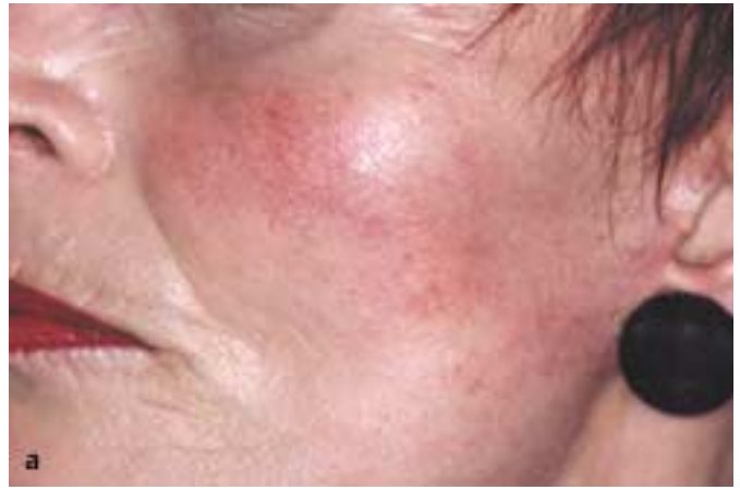
Abb. 4 a Teleangiektasien

Tief liegende benigne venöse Gefäßveränderungen können prinzipiell chirurgisch, durch Sklerosierung und den Nd:YAG-Laser (perkutan/interstitiell) behandelt werden. Die Nebenwirkungen