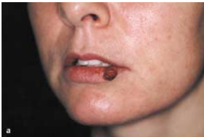
Abb. 5 a Granuloma pyogenicum.